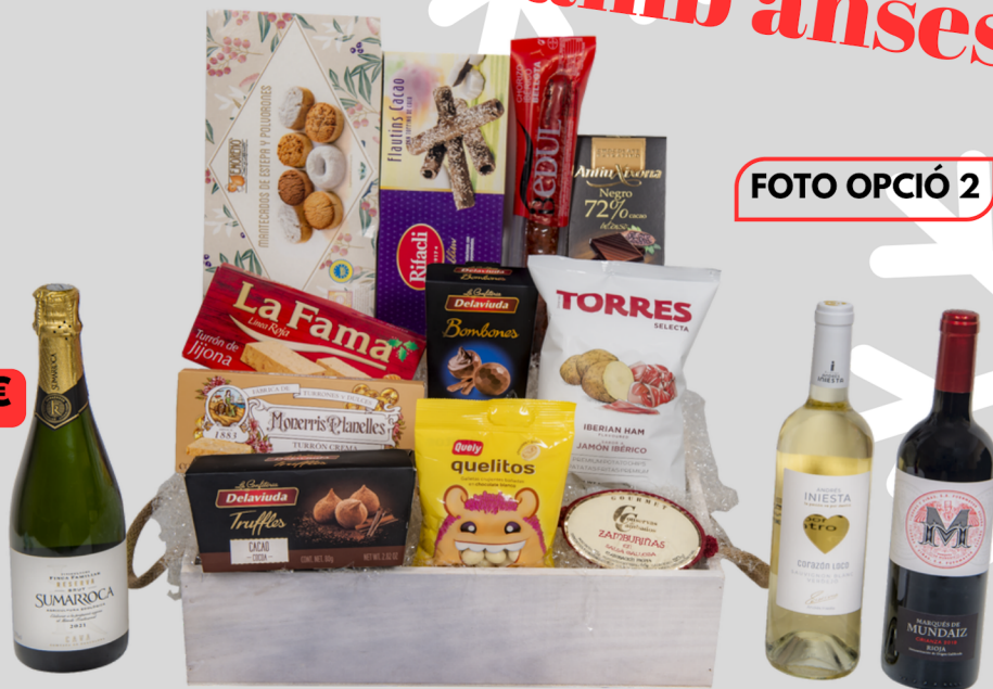
FOTO OPCIO 2