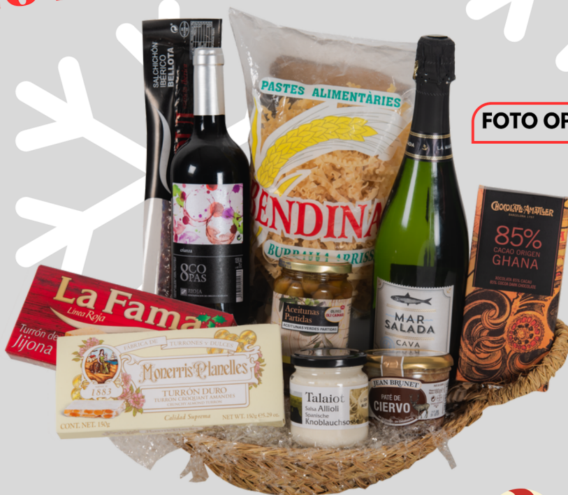
FOTO OPCIÓ 2