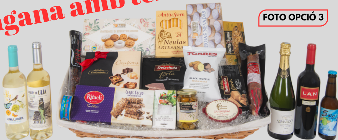
FOTO OPCIO 3