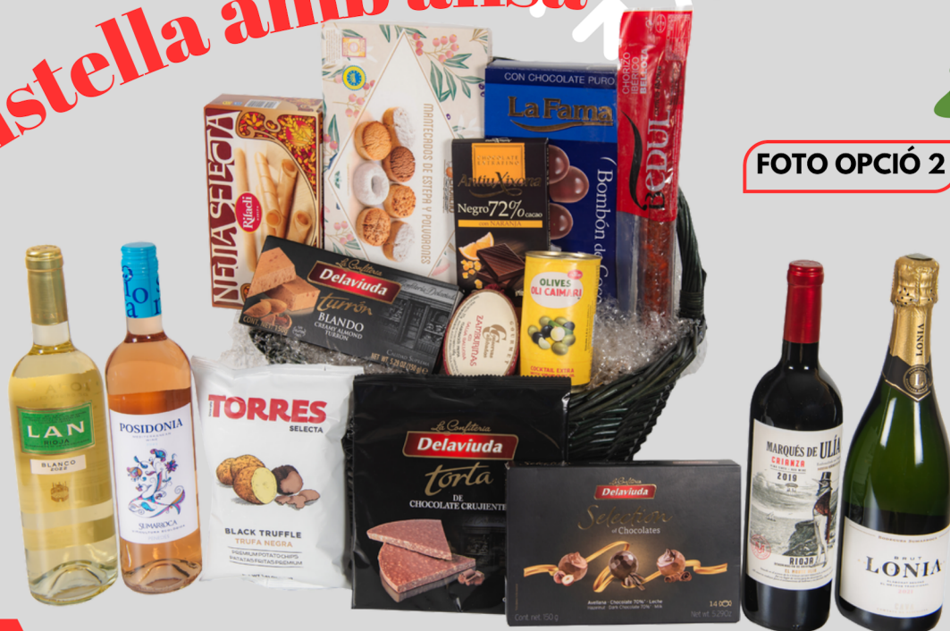
FOTO OPCIÓ 2